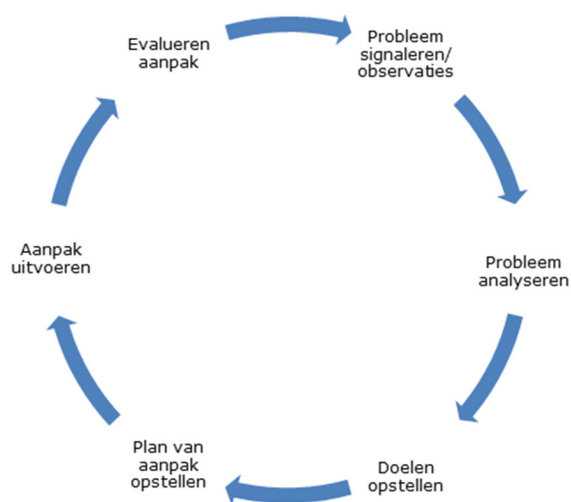
Cyclus van planmatig handelen

Binnen de zorgstructuur van College De Meer wordt gewerkt volgens het model "cyclus van planmatig handelen" (handelingsgericht werken). De cyclus wordt op elk niveau, bij elk overlegmoment doorlopen. Daarbij staat de zorg rond de leerling centraal. Afspraken over hoe te handelen beginnen altijd met een signaal. Er is een signaal dat de leerling zich niet volgens verwachting ontwikkelt; er is een leerprobleem, gedragsprobleem, sociaal emotioneel probleem, sprake van demotivatie, etc.